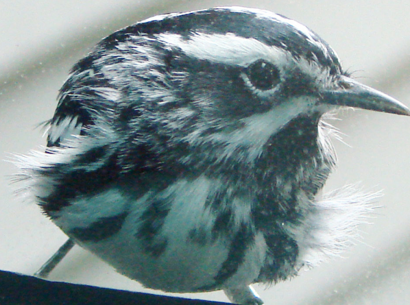
Reinita trepadora.

Millones de aves mueren cada año al chocar contra puertas y ventanas de vidrio. Las aves no pueden distinguir entre el cielo y la vegetación real y el reflejo de estos en el vidrio. La mitad de los choques o colisiones ocurren en casas.