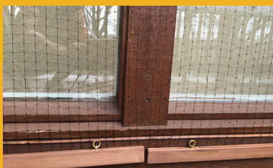
Las mallas o redes deben ser lo suficientemente tupidas para que aves peque  as no puedan pasar a trav  s de ellas.