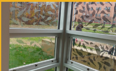
Etiquetas hechas a mano creadas por la artista Lynne Parks.

Todas las fotos de esta p  gina por Christine Sheppard a menos que se indique lo contrario.