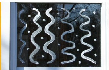
La t  mpera es una soluci  n lavable, duradera y no t  xica para prevenir las colisiones de p  jaros/ventanas.