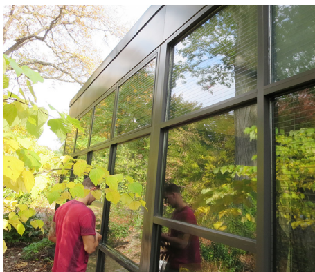
La “película de seguridad para las aves”, Solyx, cubre toda la superficie del vidrio de esta ventana en el zoológico del Bronx.