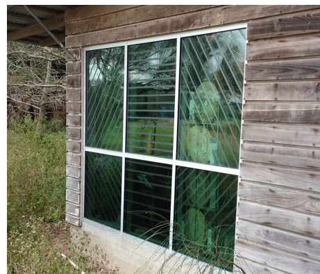
“Cinta para aves” de ABC, en una ventana en el parque estatal Estero Llano Grande en Texas. La cinta puede cortarse y aplicarse en diferentes formas y patrones.