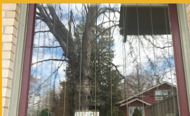
Usted puede hacer una cortina de viento Zen con cuerda o cualquier otro material que cuelgue delante del vidrio a intervalos de 10 cm.