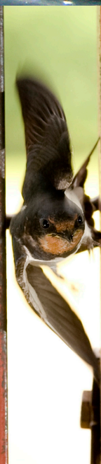
Esta golondrina común voló por éste espacio reducido a una velocidad muy alta—más de 45 km/hora!

Aplicar patrones irregulares espaciados a menos de 5 cm también funciona.