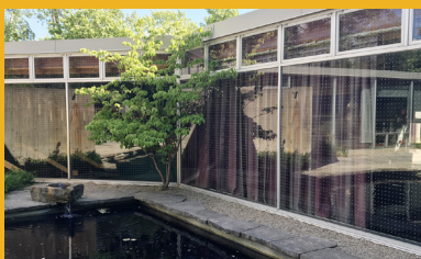
Feather-Friendly-Residential se aplica como una cinta adhesiva, pero el respaldo se quita, dejando un patr  n de puntos.